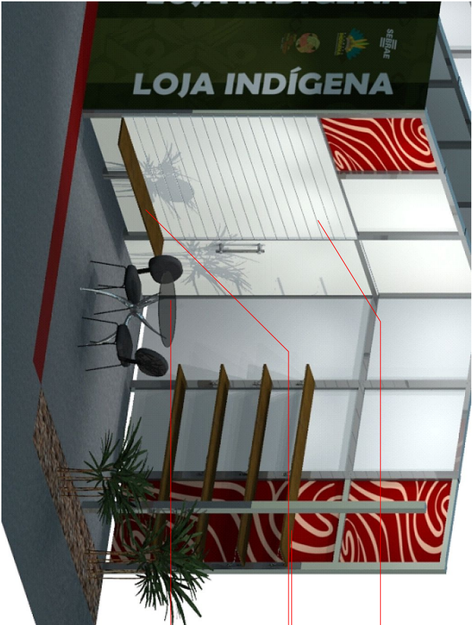
3D LOJA DE ESQUINA

Painel canaletado no laminado melamínico cor branca com bordas fitadas com fita da mesma cor, fixação tipo spyder Medida: 2,00x 1,22 x 18mm