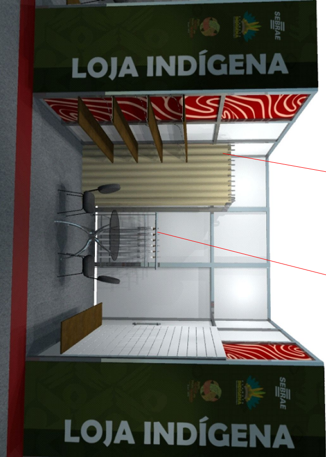
3D LOJA MEIO AJUSTE ESPECIAL CONFECÇÃO

Painel canaletado no laminado melamínico cor branca com bordas fitadas com fita da mesma cor, fixação tipo spyder Medida: 2,00x 1,22 x 18mm